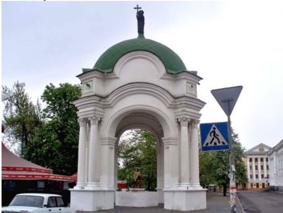
Водогін і фонтан «Самсон»

З наявних нині будівель Григоровича-Барського привертає особливу увагу Покровська церква (1766) на однойменній вулиці. Немає сумніву, що на зодчого справив певне враження славетний петербурзький архітектор Растреллі, за чийм проектом зводилася Андріївська церква. Просто з Покровської вулиці можна побачити разом витвори Растреллі і Григоровича-Барського та знайти деякі спільні риси — зокрема, напівкруглі вигнуті фронтони. Але, як зауважив мистецтвознавець Федір Ернст, «розробка фасаду не має нічого спільного зі стилем Растреллі: своєю спокійною, ясною краскою вона наближається до епохи класицизму, а трибанна система надає їй типового українського колориту».