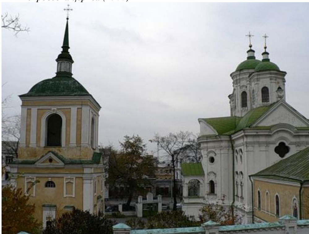
Покровська церква (1766)

Дуже приємне враження справляють затишні ганочки обабіч церкви. Так само на Подолі збереглася й Набережно-Микільська церква (1772—1775) на вулиці Григорія Сковороди. Щоправда, вигляд цієї стрункої будівлі було дещо змінено пізнішою перебудовою бані у візантійському стилі. Зберігся, хоч і дуже перебудований, «городской магазин» — колишній хлібний склад по вулиці Братській, 2. а старий гостинний дім біля Межи гірської вулиці та житлової оселі Грецького монастиря і Юрія Драчеві, що стояли на Контрактовій площі, давно втрачено. Кілька гарних споруд традиційно приписують зодчому через близькість до його стильової манери — зокрема, дзвіницю Ближніх печер лаври, залишки церкви Костянтина й Олени на розі вулиць Щекавицької та Костянтинівської (Фрунзе).