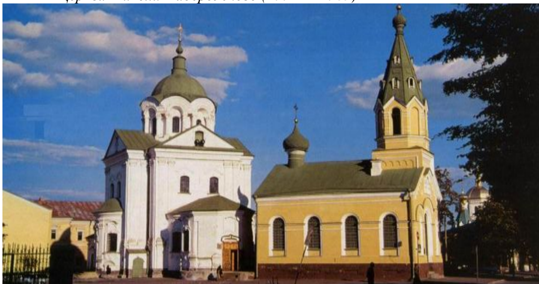
Церква Миколи Набережного (1772 — 1785)

З наявних нині будівель Григоровича-Барського привертає особливу увагу Покровська церква (1766) на однойменній вулиці. Немає сумніву, що на зодчого справив певне враження славетний петербурзький архітектор Растреллі, за чийм проектом зводилася Андріївська церква. Просто з Покровської вулиці можна побачити разом витвори Растреллі і Григоровича-Барського та знайти деякі спільні риси — зокрема, напівкруглі вигнуті фронтони. Але, як зауважив мистецтвознавець Федір Ернст, «розробка фасаду не має нічого спільного зі стилем Растреллі: своєю спокійною, ясною краскою вона наближається до епохи класицизму, а трибанна система надає їй типового українського колориту».